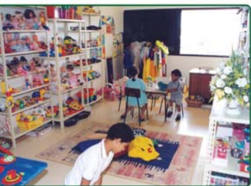
Abr. 2003 1º Aniversário da Brinquedoteca do HES.