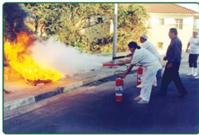
Ago. 2003 Formação da primeira Brigada de Incêndio do HES.