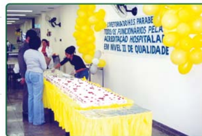
Set. 2003 HES homenageia os funcionários pela conquista da Acreditação Nível 2.