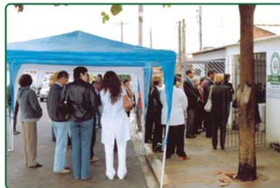
Jul. 2003 Inauguração da expansão da Casa de Apoio Viva Feliz.