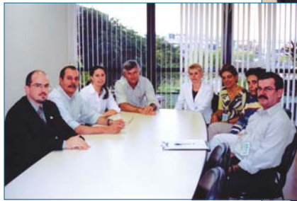
A equipe da ONA antes da auditoria